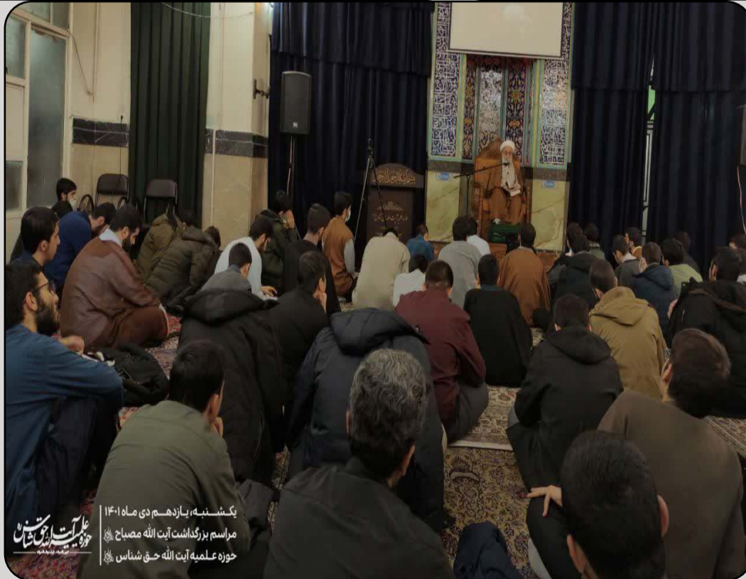
یکشنبه، یازدهم دی ماه ۱۴۰۱ مراسم بزرگداشت آیت الله مصباح حوزه علمیه آیت الله حق شناس