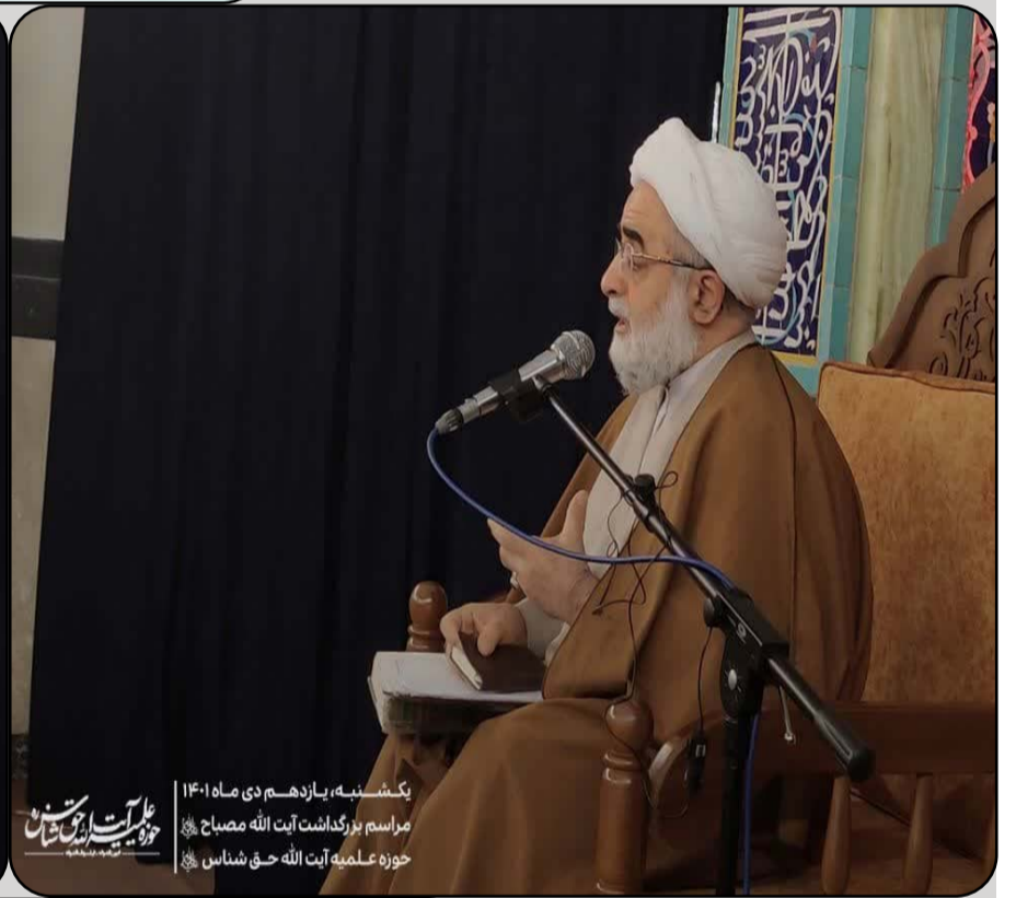
یکشنبه، یازدهم دی ماه ۱۴۰۱ مراسم بزرگداشت آیت الله مصباح حوزه علمیه آیت الله حق شناس